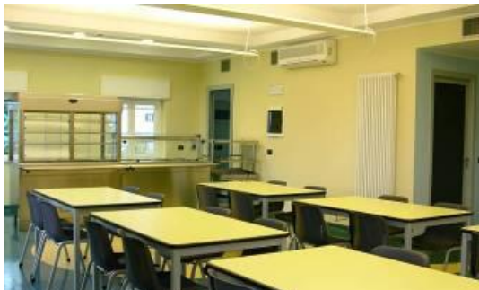
Sala Mensa Dipendenti

L'organizzazione di cucina prevede un menù a rotazione mensile, con due tipologie stagionali, che consente la scelta tra diverse pietanze. Il paziente sarà invitato a scegliere sulla base delle sue preferenze (compatibilmente con la dieta eventualmente prescritta) e la sua "prenotazione" annotata dal personale dedicato su sistema di prenotazione on line.